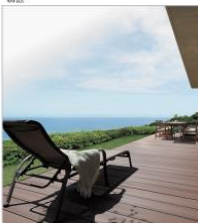
樹ら索ステージ 木彫 (LIXIL) 木質建材の切削加工過程で発生した木粉と 再生プラスチックを活用