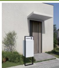
スマート宅配ポスト (LIXIL) 再配達に伴う労働生産性の向上やCO2削減に 貢献